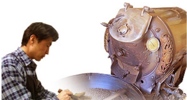
1915年頃製造 米国製焙煎機使用