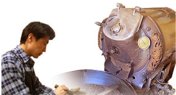
1915年頃製造 米国製焙煎機使用